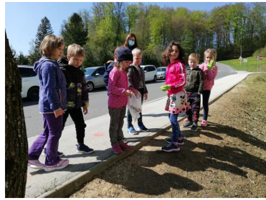
SKRIB ZA ČISTO NARAVO V OKOLICI VRTCA