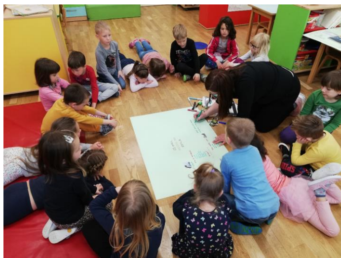
IZDELAVA PLAKATA OB POGOVORU O POMENU NARAVE ZA VSA ŽIVA BITJA