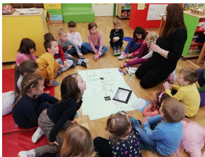
IZDELAVA PLAKATA IN JEZIKOVNE DEJAVNOSTI OB BESEDAH ZEMLJA IN PLANET

Po dejavnostih v igralnici smo po daljši poti odšli v smeri gozdička in pobrali smeti ter prispevali svoj delček pri skrbi za čistejšo naravo v okolici našega vrtca.