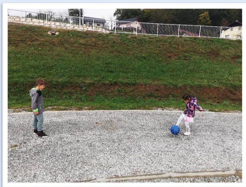
vzgojiteljice Mehurčkov, Žogic in Gumbkov