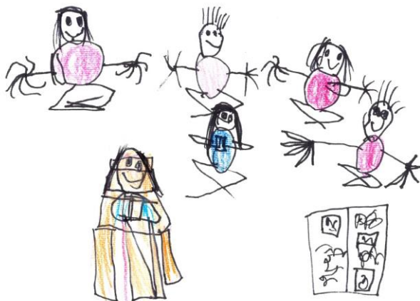
LUCIJA, 6 LET

OTROCI V VRTCU OB IGRI RAZISKUJEJO, GRADIJO PRIJATELJSKE ODNOSE, SKRBIJO ZA NARAVO, SPOZNAVAJO IN SPREJEMAJO RAZLIČNOSTI.